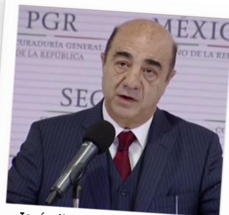
Jesús Murillo Karam, titular de la PGR (2012-2015)

"No hay una sola evidencia de que haya intervenido el Ejército, ni una sola."