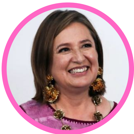
Xóchitl Gálvez 15 mayo 2024