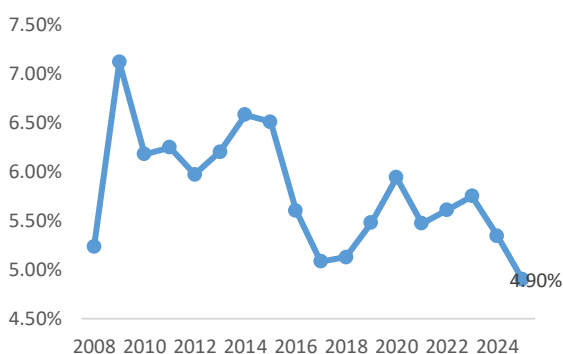
Gráfico 1. Gasto que detona desarrollo económico % del PIB