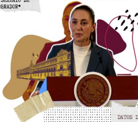
DATOS DEL SEXENIO DE CLAUDIA SHEINBAUM

374 mujeres víctimas de homicidio doloso