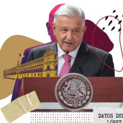
DATOS DEL SEXENIO DE LÓPEZ OBRADOR*

16,030 mujeres víctimas de homicidio doloso